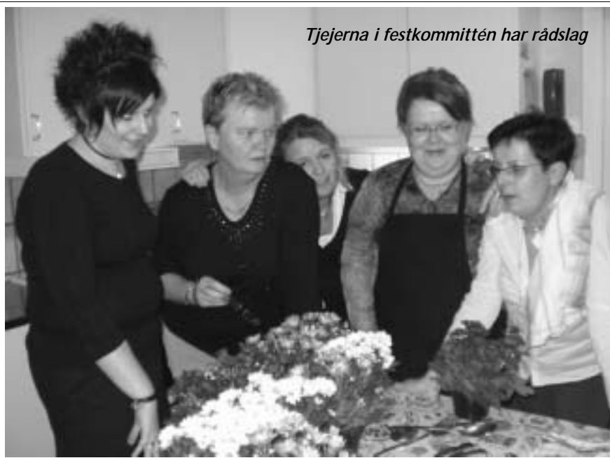
Tjejerna i festkommittén har rådslag