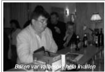
Baren var välbesökt hela kvällen