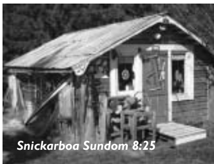
Snickarboa Sundom 8:25

Den ligger strax söder om Gussövägen, där den går in i skogslandet norr om Strandberget. Den var från början en myr som genom gångna och nuvarande släkten förvandlats till en slätteräng som kunde fylla fem lador med foder. Ladornas namn var: Fårhusladan , Ormladan , Roddladan , Knussladan och Storladan . Ormladan fick sitt namn för att en och annan orm just där blev dödad sommartid. Den flyttades och drogs ut en första gång. Efter andra flyttningen är den ”snickarboa” vid