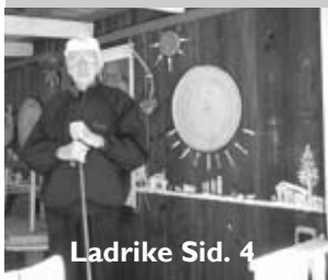
Ladrike Sid. 4

Nr 2 Juni 2005 • Sundoms Informationstidning