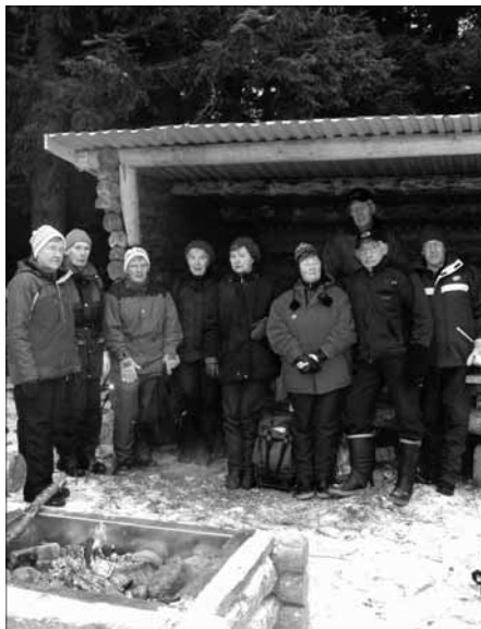
Vindskyddet vid Gussöskatan