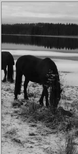
Birks betraktelser Sid. 10-12

Nr 1 februari 2009 • Sundoms Informationstidning