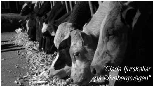
"Glada tjurskallar på Rävbergsvägen"

Tel: 070-675 82 26 eller hem: 0920-745 37