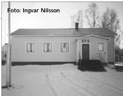
Bönhuset år 2003