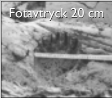
Fotavtryck 20 cm