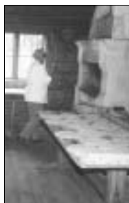
Elvi bakar mjukkakor.

Bodan är byggd år 1917 av bräder och med spåntak, nu med ett eternittak som skydd för den stenmangel som finns där inne. Mangeln är handgjord 1917 av några snickarkunniga karlar. Ovanpå rullarna finns en låda som är fylld med stora stenar som tyngd. Den dras av 2 personer. Den brukades även av en del damer från byn, som kom med stora tvättkorgar, körandes hit med häst och vagn och medhavd kaffekorg för fikarast. Mangeln används fortfarande, särskilt linnetyger blir släta och fina.