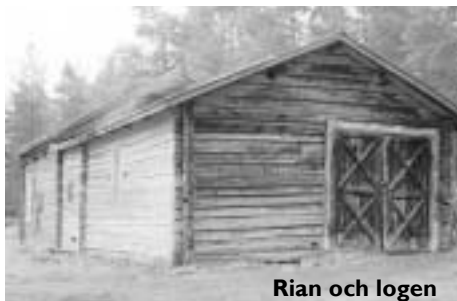
Rian och logen