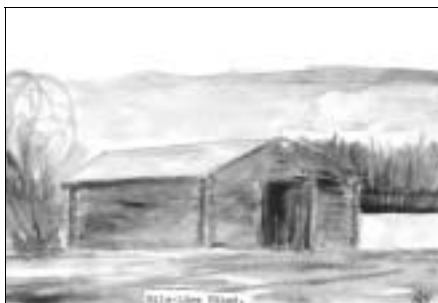
Text och illustration: Ingvar Nilsson

I början av förra seklet och 30-40 år framåt fanns i Sundom fjorton sommarladugårdar (somarfeosa). Av dessa är endast två kvar och de har en helt annan uppgift. Den ena tillhör Nils-Läärs och den andra tillhör Jaahans. Mer om dessa senare.