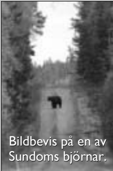
Bildbevis på en av Sundoms björnar.

Nr 3 September 2004 • Sundoms Informationstidning