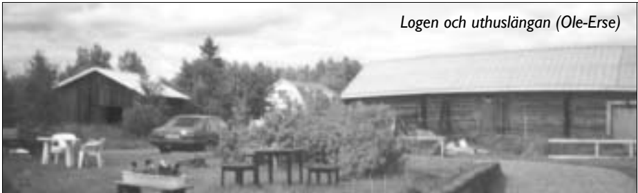
Logen och uthuslängan (Ole-Erse)

med tak av grönmålad pannplåt. Därunder finns ett sticktak. Härbret har en utskjutande gavelsvale och står på stolpar på en syllram. På gaveln finns ett litet kvadratisk fönster i två delar som är spröjsat.