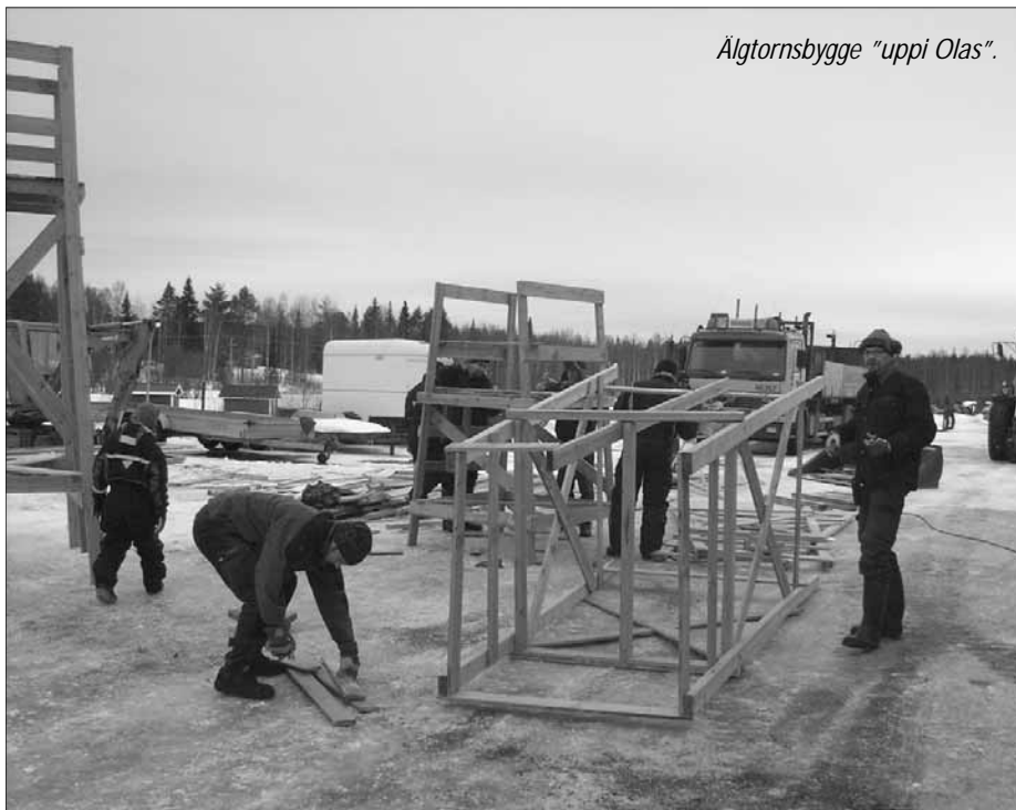
Älgtornsbygge "uppi Olas".