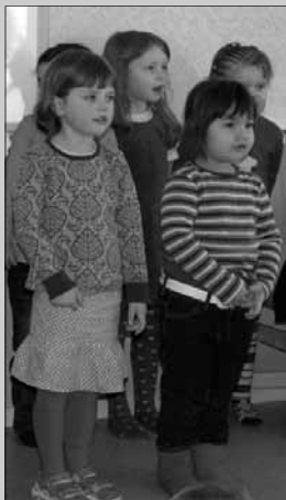
Nya förskolan invigd Sid. 12-13

Nr 2 maj 2009 • Sundoms informationstidning