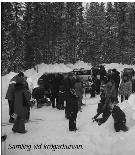
Samling vid krögarkurvan.