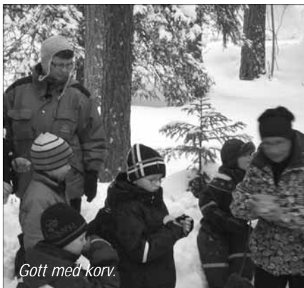
Gott med korv.