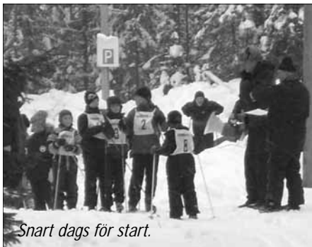
Snart dags för start.