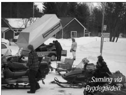
Samling vid Bygdegården.