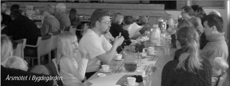
Årsmötet i Bygdegården.