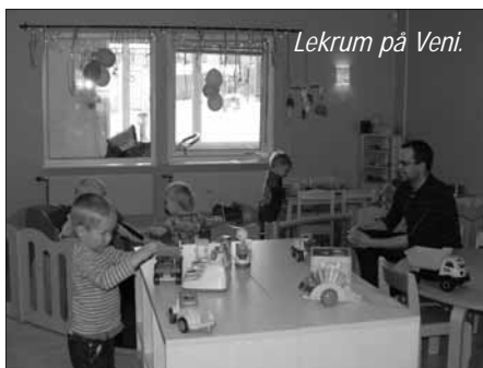
Lekrum på Veni.

*SMART Board är en interaktiv whiteboard/skriftavla. Runt om i världen har whiteboards och blädderblock ersatts av SMART Boards.