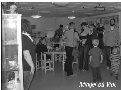
Mingel på Vidi.