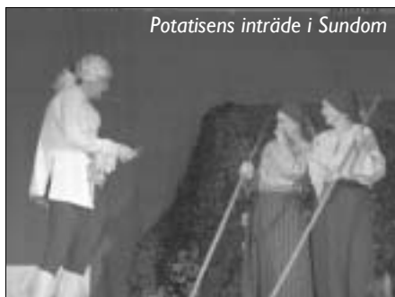
Potatisens inträde i Sundom

Efter 1600-talets hungersnöd bjöd 1700-talet på lite mer framtidstro då Gustav III inspirerade Sverige med allehanda franska inslag. Hubert (Per Nordgren) gjorde här en bejublad entré iförd trikaer, vit stor kråsskjorta, vit långhårig peruk med hästsvans och med en spetsnäsduk viftandes i handen. Han föreställde en mer välbärgad medborgare från Råneå som varit på