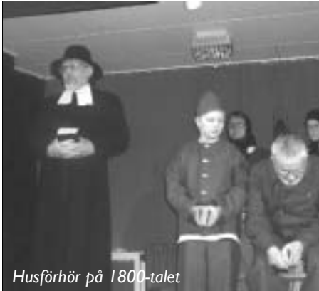
Husförhör på 1800-talet

Under 1800-talet får vi bl.a stifta bekantskap med den tidens husförhör, då prästen (Nilseric) gör sitt yttersta för